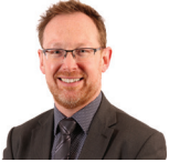
Russell George AC Ceidwadwyr Cymreig